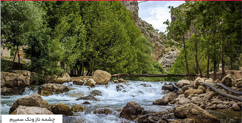
چشمه ناز ونگ سمیرم

شنبه ۱۰ بهمن‌ماه ۱۳۹۴ || ۳۰ ژانویه ۲۰۱۶ || ۱۹ ربیع‌الثانی ۱۴۳۷ صاحب‌امتیاز و مدیرمسئول: مظفر حاجیان || سردبیر: مدیقه ابروانی ویژه استان‌های: اصفهان، کرمان، یزد، چهارمحال و بختیاری فراخ و صفحه‌آرا: اطلس محمودیان فرد || چاپ: رسانه برتر دفتر مرکزی: اصفهان، خیابان سفیر، جنب کوچه ۱۶، پلاک ۴۳ تلفکس: ۰۵۸۰۳۲۲۹۸ - ۰۳۱ - ۲ || ۰۵۱۰۳۷۵۱ - ۹۵۱۳۷۰۳۱