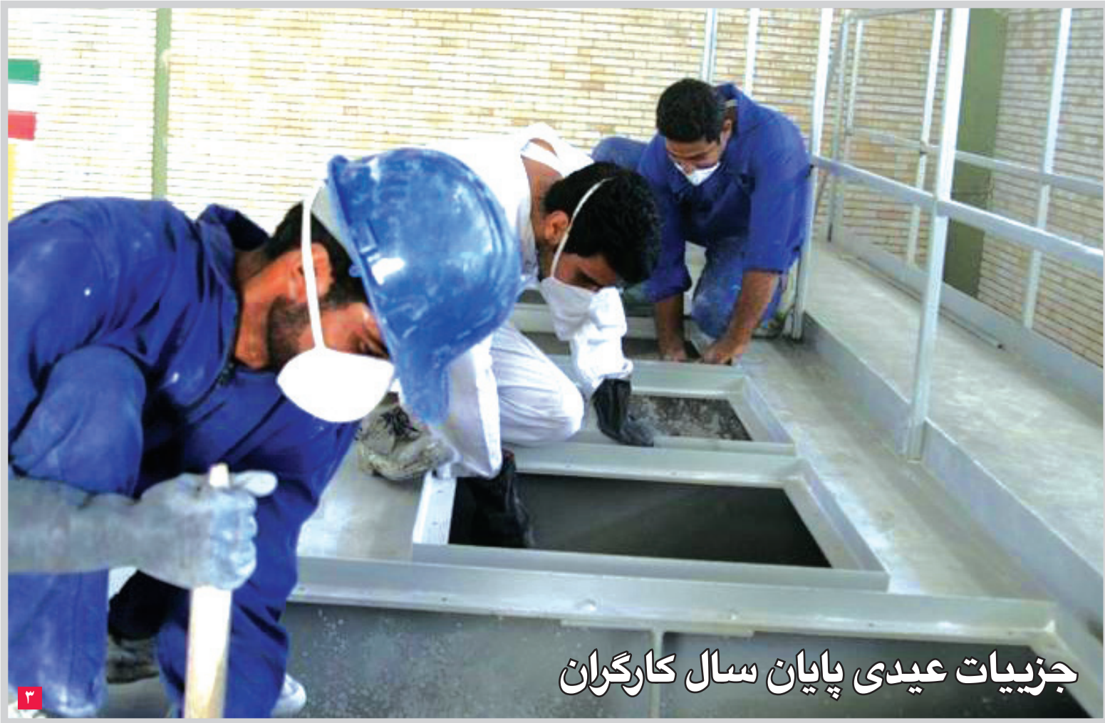
جزئیات عیدی پایان سال کارگران