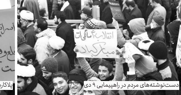
دست‌نوشته‌های مردم در راهپیمایی ۹ دی

رهبر معظم انقلاب اسلامی در حکمی آیت‌الله آملی لاریجانی را به عنوان رئیس مجمع تشخیص مصلحت نظام و عضو فقهای شورای نگهبان منصوب کردند. متن حکم رهبر انقلاب اسلامی به این شرح است: بسم الله الرحمن الرحیم آیت‌الله جناب آقای حاج شیخ صادق آملی لاریجانی دامت توفیقاته با توجه به نقش بی‌بدیل مجمع تشخیص مصلحت نظام در اداره و قوام و استحکام نظام مقدس جمهوری اسلامی و با عنایت به ارتحال عالم مجاهد آیت‌الله هاشمی شاهرودی رحمه‌الله‌علیه و ضرورت سامان‌یابی هرچه سریع‌تر ارکان مجمع، جنابعالی را به ریاست آن مجمع مهم و تأثیرگذار و نیز به عضویت فقهای شورای محترم نگهبان منصوب می‌کنم. همان‌طور که پیش از این در حکم دوره جدید آمده است، مجمع در این دوره عهددار مسئولیت مهم و اساسی تغییرات در ساختار و