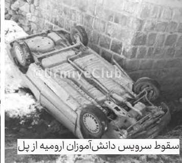
سقوط سرویس دانش‌آموزان ارومیه از بل

دخلی شرایط انتخاب شهرداران پس از ۲۰ سال تغییر کرد سید سلمان سامانی، سخنگوی وزارت کشور از تغییر این‌نامه شرایط انتخاب میانی جهت سمت شهردار توسط هیئت دولت خبر داد و اظهار داشت: این آیین‌نامه به استانداران سراسر کشور برای اجرا ابلاغ شد. وی افزود: براساس این‌نامه جدید کسانی را می‌توان به سمت شهرداری‌های شهری، در شرایط اوجهله تابعیت جمهوری اسلامی ایران، حداقل سن سال سن، انجام خدمت وظیفه عمومی یا معافیت دائم در زمان صلح برای مردان اعلام اعتقاد به میانی جمهوری اسلامی ایران و قانون اساسی و نداشتن کمکویت کفبری مؤثر باشد. سخنگوی وزارت کشور تصریح کرد: در آیین‌نامه اجرایی جدید شروط عامه اعتیاد به مواد مخدر و روزگاران و خدایات و داشتن مدارک تحصیلی کارشناسی مرتبط پیش‌بینی شده است. سامانی با بیان اینکه شرایط سوابق اجرایی شهرداران به صورت مبسوط در ۶ بند و ۷ تبصره تشریح شده است گفت: ۳ سال سابقه مدیریت پایه یا ۵ سال سابقه کارشناسی در شهرداری برای شهرداری‌های شهری تا ۱۰ هزار نفر جمعیت، ۵ سال سابقه مدیریت پایه برای شهرداری‌های شهری با جمعیت ۵۰ هزار تا ۲۰۰ هزار نفر، ۷ سال سابقه مدیریت میانی برای شهرداری‌های شهری با جمعیت ۲۰۰ هزار تا ۵۰۰ هزار نفر، ۹ سال سابقه مدیریت میانی برای شهرداری‌های شهری با جمعیت ۵۰۰ هزار تا یک میلیون نفر و ۹ سال سابقه مدیریت ارشد برای شهرداری‌های شهری با جمعیت بیش از یک میلیون نفر از شروط تعیین شهرداران است.