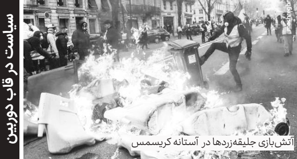
آتش‌بازی حلیقه زردها در آستانه کریسمس

وی با بیان اینکه مقاومت در مقایسه با گذشته از ظرفیت و توانمندی زیادی در برابر متجاوزان برخوردار شده است، افزود: حاصل این توانمندی‌ها در راهپیمایی‌های بازگشت و شکست نهاجم اخیر رژیم صهیونیستی جلوه‌گر شد که اعلام انتخابات زودهنگام در سرزمین‌های اشغالی از ثمرات آن است.