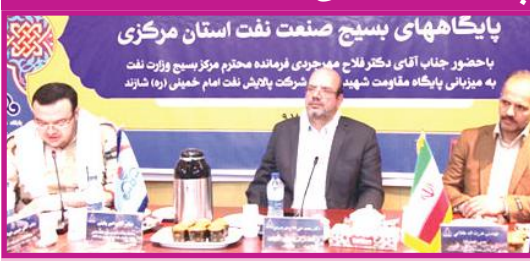
تهمنه دیباغ چی لاک