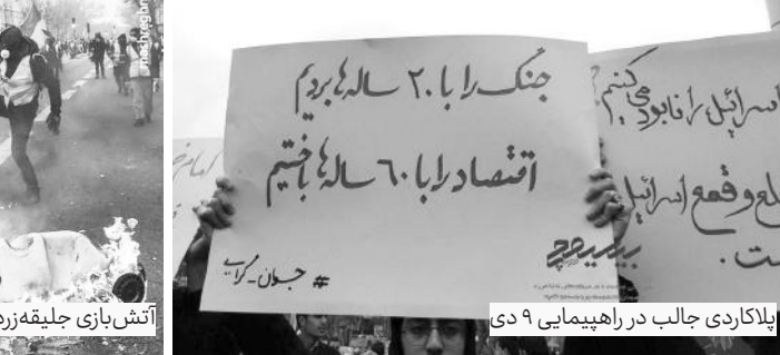
بلاکاردی جالب در راهپیمایی ۹ دی

وی با بیان اینکه ۹ دی تصویری زیبا از تجلی حضور مقتدرانه ملت ایران در صحنه بود و توطئه‌های دشمنان را خنثی کرد، اظهار داشت: ۹ دی نشان داد ملت ایران از تاریخ اسلام درس گرفته و اجازه تسلط دوباره استکبار را بر سرنوشته داد نمی‌دهد. ۹ دی آغاز یک تاریخ جدید است و ملت در تاریخ دوباره درخشیدند. داد ایران به قوت رهبر حکیم نشان داد اگر دشمنان ملت ایران را تهدید کنند، این ملت آن را خنثی می‌کنند و پیروز نهایی ملت ایران هستند و این نور حقیقت خاموش نمی‌شود. سردار سلامی در ادامه تصریح کرد: ای